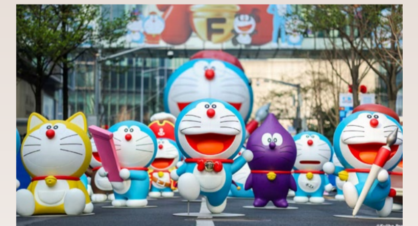
◆ 展覽吸引過千訪客