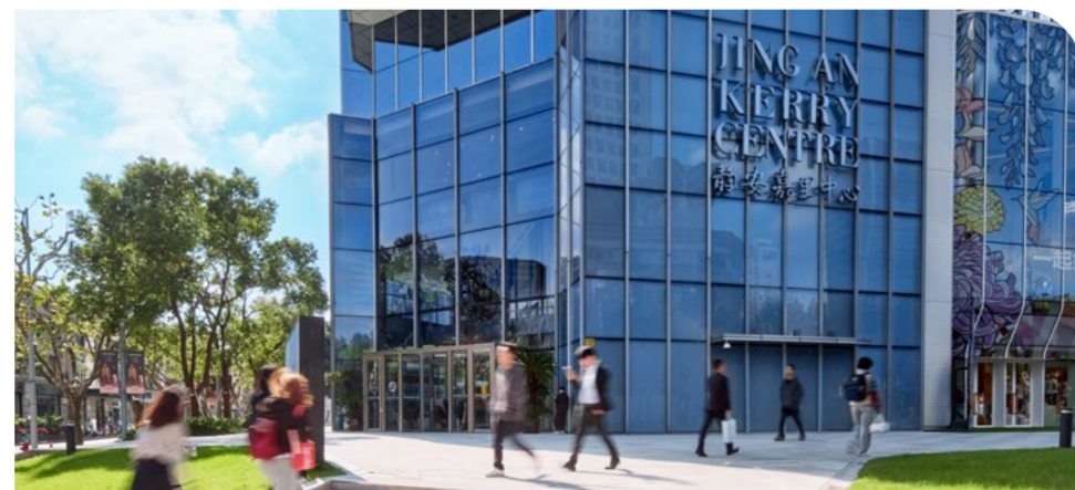
◆ 上海靜安嘉里中心

繼我們在深圳前海嘉里中心及北京嘉里中心成功推出WELL主題活動後，上海靜安嘉里中心的「共益智匯公約」進一步展現我們推動以健康生活為主的空間營造之承諾。