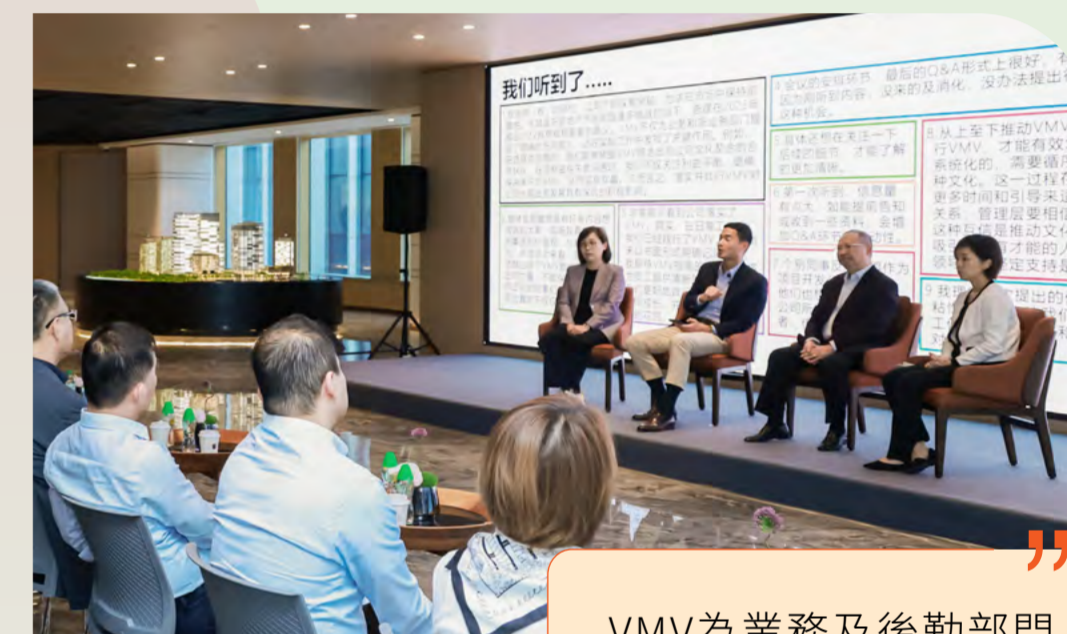
◆ 員工大會 @ 深圳

行政總裁其後分別於上海、深圳及北京主持三場員工大會，為同事提供開放而坦誠的對話平台，加強領導力並促進在跨區域的聯繫、協同與參與度。