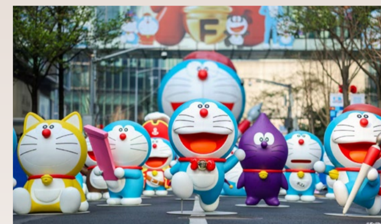
◆ 展览吸引过千访客