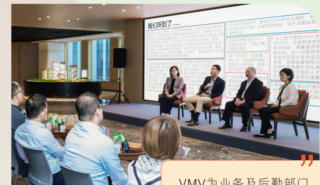
◆ 员工大会 @深圳

行政总裁其后分别于上海、深圳及北京主持三场员工大会，为同事提供开放而坦诚的对话平台，加强领导力并促进在跨区域的联系、协同与参与度。